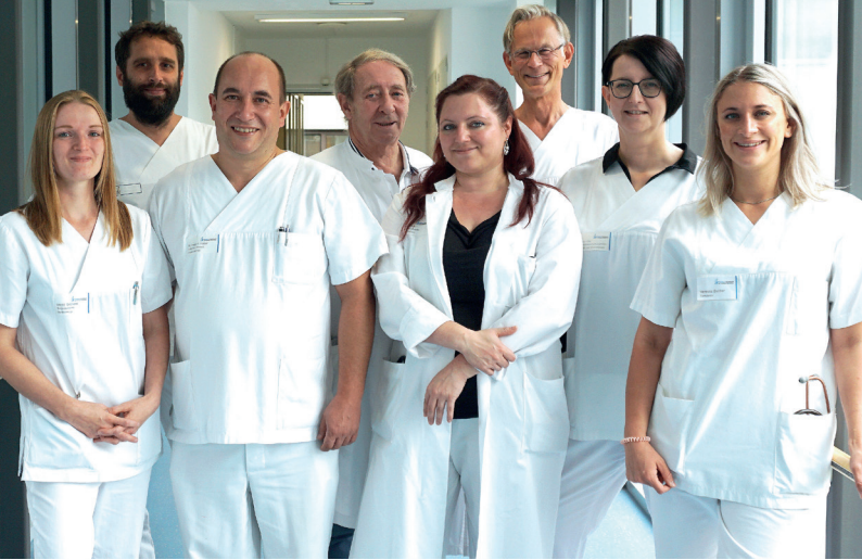
Das Team der Klinik für Thoraxchirurgie

In unserer Klinik für Thoraxchirurgie werden Erkrankungen der Lunge, des Brustmittelfellraumes (Mediastinum), des Zwerchfells, der Brustwand und des Rippenfells mit modernsten operativen Verfahren, einschließlich minimal-invasiver, computerassistierte da Vinci®-Eingriffe, behandelt. Dabei wird das gesamte Behandlungsspektrum nach den neuesten wissenschaftlichen Erkenntnissen und Standards angeboten. Unser Klinikum hat eine etablierte Tumorkonferenz mit allen notwendigen Krebspezialisten. Zusammen mit den Kollegen der Klinik für Anästhesie wird eine optimale Schmerztherapie sowie eine professionelle postoperative Intensivüberwachung gewährleistet. Eine spezialisierte Atemgymnastik und Krankengymnastik wird ebenfalls durchgeführt. Auf Station werden Sie von unserem hochmotivierten Pflegeteam behandelt.