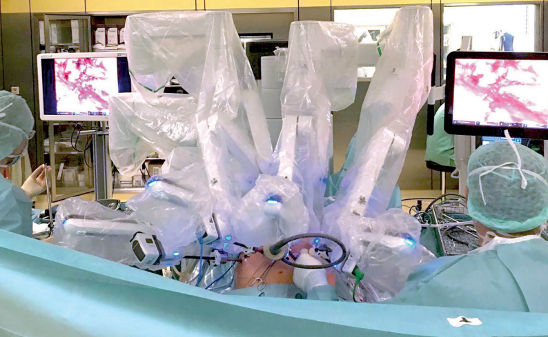
Thoraxchirurgische OP mit da Vinci® System